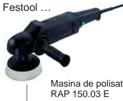
Masina de polisat RAP 150.03 E