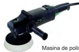
Masina de polisat Pollux 180 E