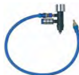
Racord IAS 2 Tip: IAS 2-A-ASA/CT Cod comanda: 454757