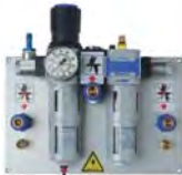
Unitate de alimentare Tip: VE 1 ASA Cod comanda: 488508