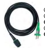
Cablul plug-it Cauciuc, 4,0 m; Tip: H 05 RN-F/4 Cod comanda: 489421 Cauciuc, 7,5 m; Tip: H 05 RN-F/7,5 Cod comanda: 489661