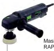
Masina de polisat RAP 80.02 E